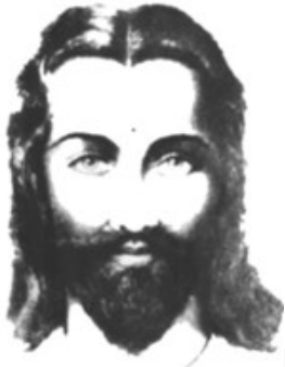
Maitreya El Señor