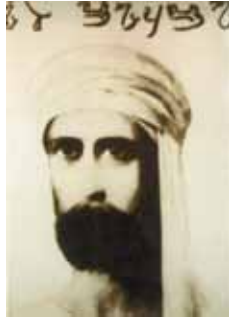
Parte 27 JATS Y SU ORIGEN