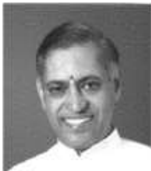
CARTA Nro. 1 CICLO 19