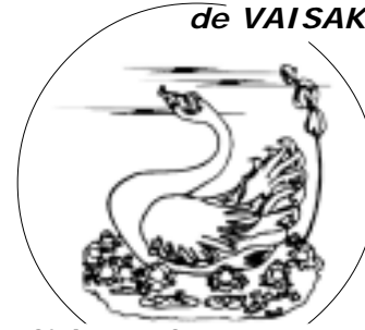
Ciclo 20, Carta núm. 11