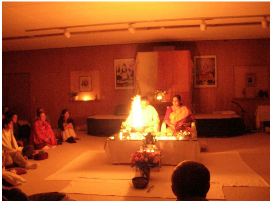
Ritual del Fuego, Bad Meinberg

El último día visitamos un lugar sagrado llamado las "Piedras Externas", que nos recordaron las montañas de Montserrat debido a su semejanza en el "diseño" de sus rocas cilíndricas y rugosas y a su color grisáceo. Allí, los 130 participantes meditamos silenciosamente con el Maestro y su esposa, sorprendiendo a la gente que visitaba el lugar.